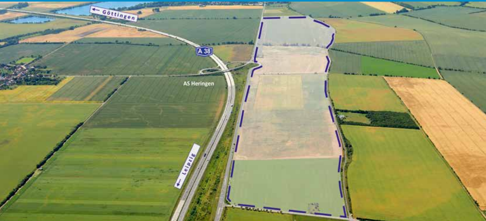
Luftbild Industriegebiet „Goldene Aue“ in Nordhausen