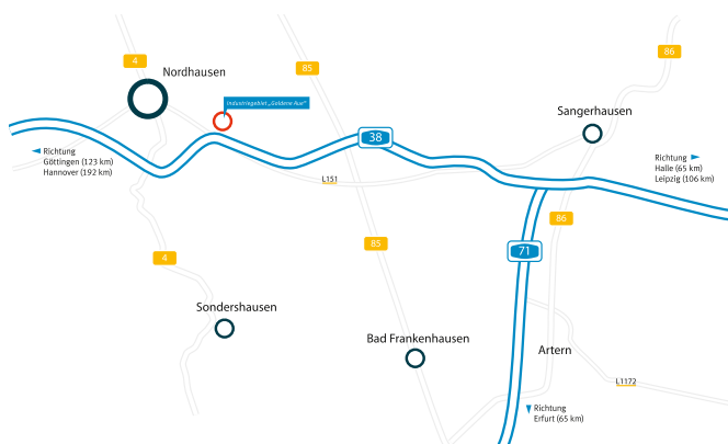
Verkehrsanbindung des Industriegebietes „Goldene Aue“

Nordhausen verfügt über einen Sonderlandeplatz für Geschäftsverkehre bis 5,7 t.