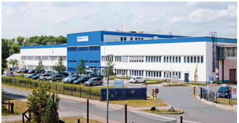
Firmengebäude von ThimmSchertler