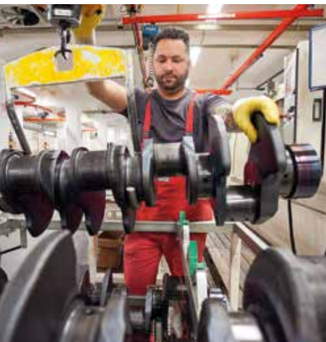
Mitarbeiter von Feuer Powertrain