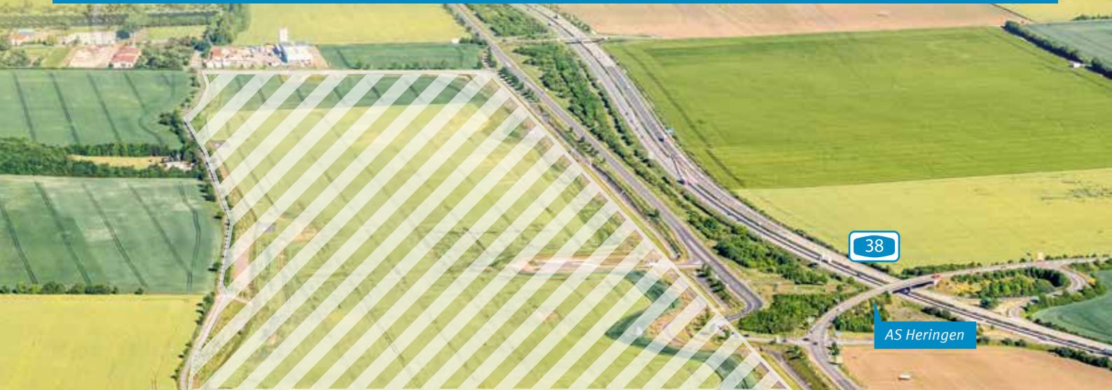
Luftbild Industriegebiet „Goldene Aue“ in Nordhausen