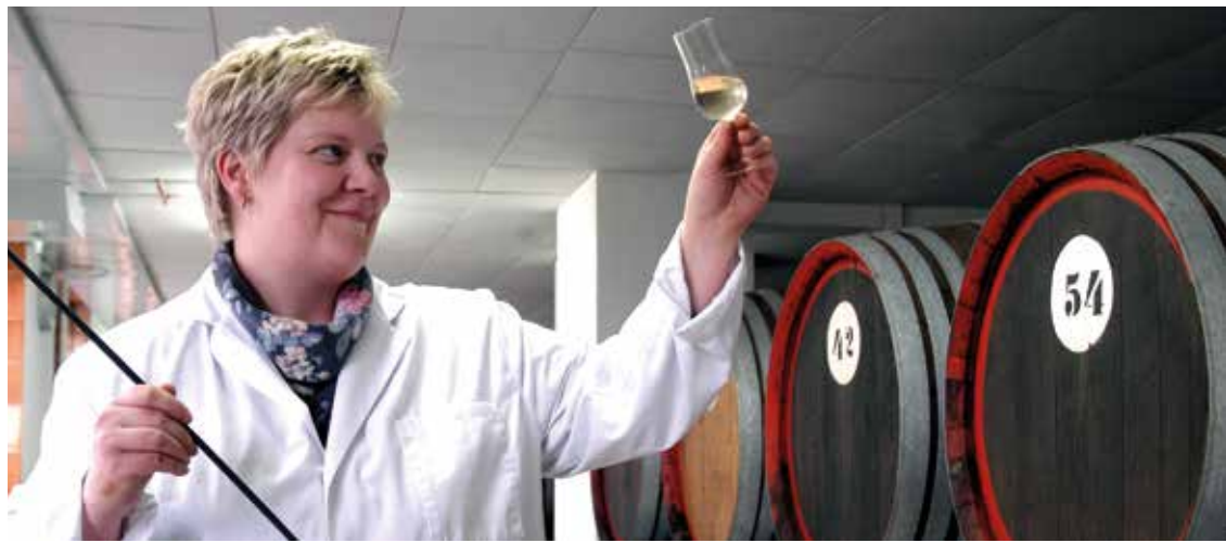
Produktionstätte Nordbrand Nordhausen