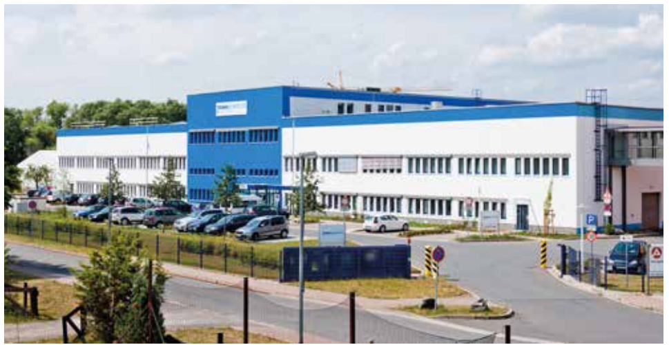
Firmengebäude von ThimmSchertler